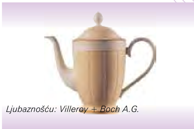
Ljubaznošću: Villeroy + Boch A.G.